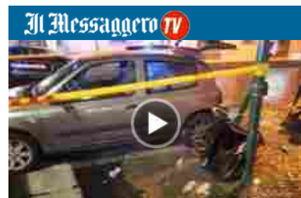
Roma, auto travolge cinque passanti a San Pietro